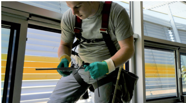
Durchführung von Reinigungsmaßnahmen